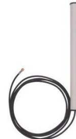
Рисунок 1 – Антенна GSM 1A900.

А также, антенна позволяет значительно увеличить скорость передачи данных при работе в режиме передачи/приема данных стандарта GPRS/EDGE.